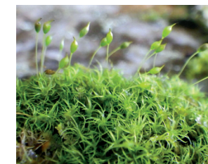
Cynodontium bruntonii (toute l'année)