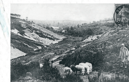
Un berger et ses moutons dans la Vallée de Misère au début du XX ème siècle (Dufour J., Moineau E. 1998)

Des travaux de génie écologique favorisent le développement des espèces caractéristiques des éboulis et permettent le maintien du milieu ouvert.