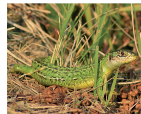
Lézard vert occidental (mars à octobre)

Mais aussi : Couleuvre d'esculape , Orvet fragile