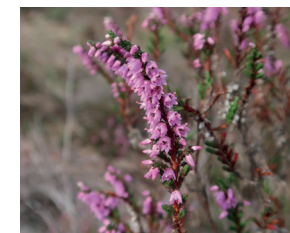
La Callune (juillet à décembre)

Mais aussi : Couleuvre d'esculape , Orvet fragile