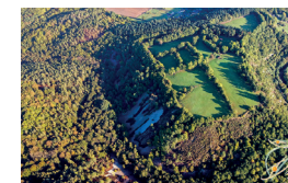
Vue aérienne de la Vallée de Misère en 2005